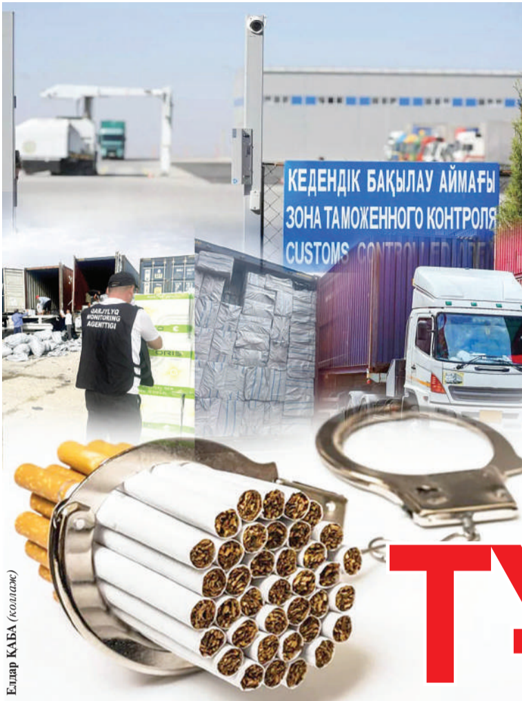
Елнар КАБА (colage)